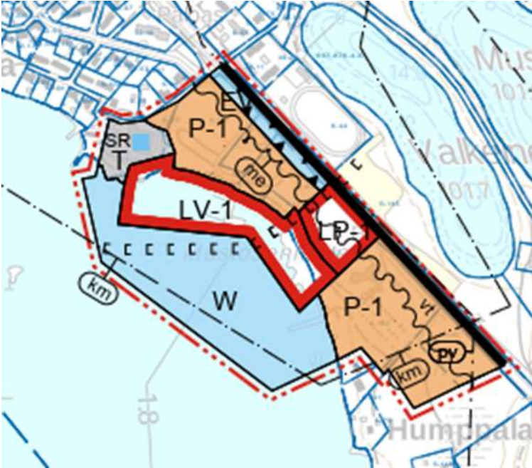
Kuva 4: Ote kirkonkylän osayleiskaavan muutoksesta 2019

Kirkonkylän yleiskaavaa on muutettu satama-alueen osalta valtuuston päätöksellä 25.3.2019 §12. Yleiskaavassa suunnittelualueelle on osoitettu LV-1, LP-1 ja P-1 alueita sekä moottorikelkkareitti.