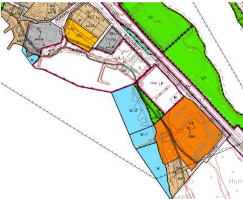
Kuva 5: Ote ajantasa-asetusta