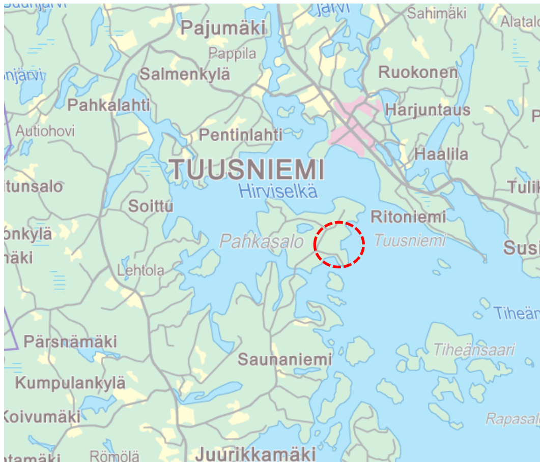
Kuva 1. Alueen sijainti.

Kaava on lähtenyt vireille maanomistajien aloitteesta. Asemakaavan laatimisesta on pidetty keskustelutilaisuus Pohjois-Savon ELY- keskuksella 28.2.2011. Asemakaavoituksen käynnistämisestä on tehty sopimus 14.10.2011 maanomistajien ja Tuusniemen kunnan kesken. Suunnittelualueen asemakaavoituksella pyritään selvittämään ja yhteen sovittamaan rakentaminen, yleinen virkistysaluetarve ja tiejärjestelyt.